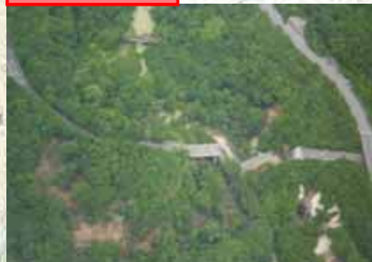
342号: 祭時大橋 (落橋)