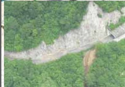
397号: 漁止スノーシート付近 (土砂崩壊)