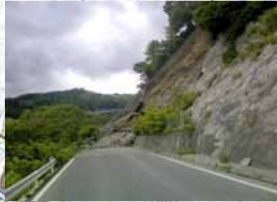
397号: 石淵トンネル東側