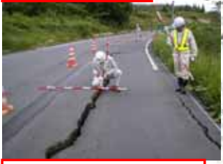
107号: ゆだ高原駅付近 片側交互 (路面沈下)