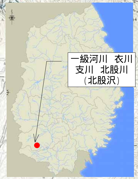
一級河川 衣川 支川 北股川 (北股沢)